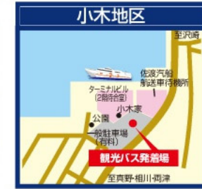
新潟交通佐渡/小木観光案内所 佐渡汽船小木港ターミナルビル1F