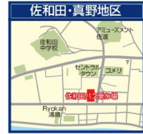
新潟交通佐渡/佐和田バスステーション 新潟交通佐和田ビル1F待合室内