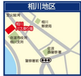
新潟交通佐渡/相川観光案内所 佐渡市役所相川支所1F