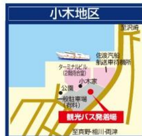
新潟交通佐渡/小木観光案内所 佐渡汽船小木港ターミナルビル1F