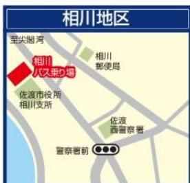
新潟交通佐渡/相川観光案内所 佐渡市役所相川支所1F