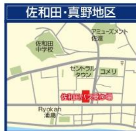
新潟交通佐渡/佐和田バスステーション 新潟交通佐和田ビル1F待合室内